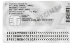
Zadní strana (s čipem)

Od 1. 1. 2012 je vydáván nový občanský průkaz se strojově čitelnými údaji (s čipem nebo bez čipu). Je vyroben ve formě plastové karty o rozměrech 54 mm x 85,6 mm (velikost platební karty), má gravírovanou černobílou fotografii a gravírovaný podpis držitele. Jméno, příjmení a číslo dokladu jsou provedeny taktilním gravírováním (lze poznat hmatem). Oba občanské průkazy jsou vzhledově stejné, liší se pouze tím, že na zadní straně je umístěn kontaktní elektronický čip.