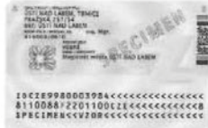
Zadní strana (bez čipu)