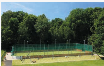
Sportovní hřiště v Dobraticích

Počet obyvatel: 674 Rozloha: 4,86 km 2 web obce: www.vojkovice.eu