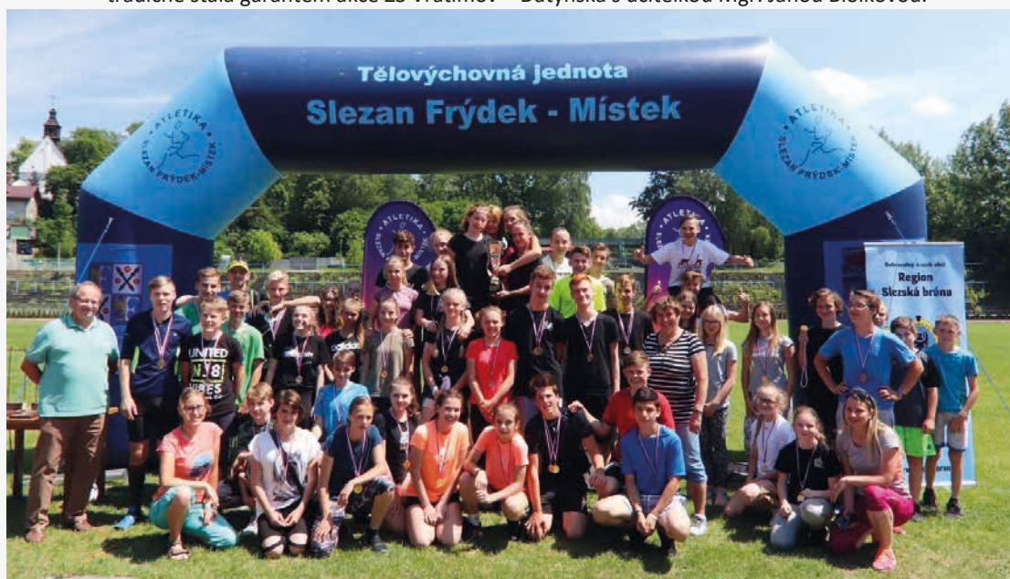
Vítězné družstvo Šenova na lehkooatletických závodech 2. stupně ZŠ na slezanském stadionu ve Frýdku