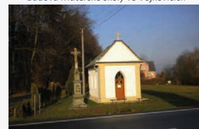
Kaple Navštívení Panny Marie ve Vojkovicích