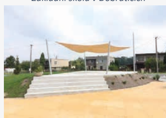
Centrum obce Dobratice