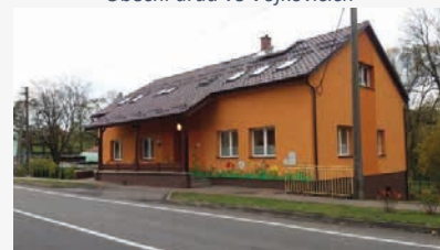
Budova Mateřské školy ve Vojkovicích