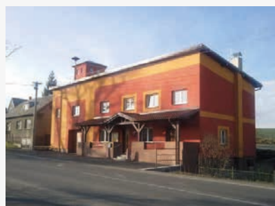
Obecní úřad ve Vojkovicích

Vojkovice měly podobnou historii jako sousední Dobratice. Založeny byly někdy počátkem 16. století. První zmínka o Vojkovicích pochází z roku 1573. Název Vojkovic má údajně původ ve jménu Vojtěch či Vojek. Vojkovice ležící na soutoku Lučiny, Holčiny a Račoku byly zemědělskou obcí s tradičním domácím tkaním. Obec leží na významné dopravní trase z Frýdku do Těšína. V minulosti se na této cestě vybíralo clo a šavle strážných, kteří cestu hlídali se dostaly také do znaku obce. Od roku 1888 doplnila obchodní cestu také železnice se zastávkou na území Vojkovic. V letech 1890 až 1948 se ve Vojkovicích vyráběla slavná Vojkovičská hořká v lihovaru rodiny Glesingrů později v Joklově lihovaru, který byl roku 1952 přebudován na kravín. Školu měly Vojkovice od roku 1869 (vyučování ale probíhalo už od roku 1846). Škola zanikla roku 1879. Mezi místní zajímavosti patří pivovar Koniček s oblíbeným Ryzákem a Grošákem. Vojkovice nemají kostel, zato zde stojí od roku 1890 kaple Navštívení Panny Marie navštěvované o poutích a listopadovém krmáši a mezi církevní zajímavosti patří také zrestaurovaná socha sv. Karla Boromejského z roku 1712, která je na seznamu národních kulturních památek. Vojkovice jsou rozlohou šestou nejmenší obcí a čtvrtou nejmenší obcí co do počtu obyvatel v rámci DSO Region Slezská brána.