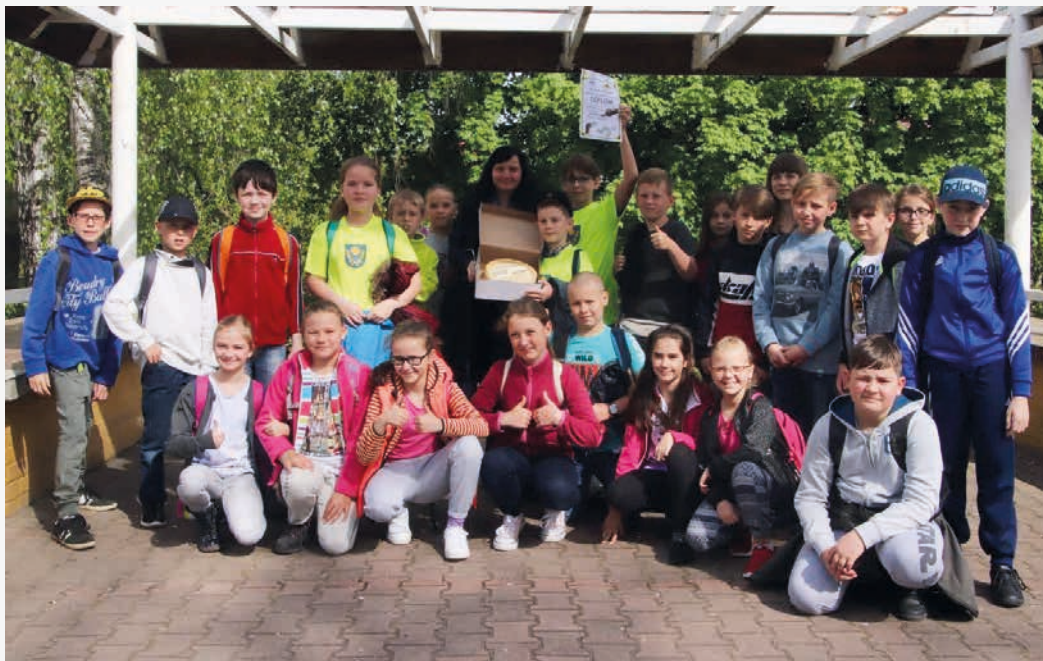
Vítězné družstvo vědomostní soutěže v kategorii žáků 1. stupně - ZŠ a MŠ Václavovice

Také proto se připravuje cyklus sportovních a vědomostních soutěží pro stejné kategorie na školní rok 2018/2019. S řediteli škol bude projednán tentokrát již před vlastním zahájením školního roku, tj. v tzv. přípravném týdnu na konci srpna. Předpokládá se opět 7 sportovních akcí a samostatná vědomostní soutěž. U vědomostní soutěže budou hledány zdroje pro financování, a to alespoň části nákladů, zapojením této aktivity do projektu Místní akční plán II.