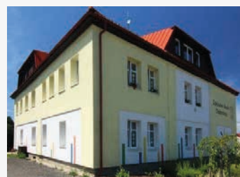
Základní škola v Dobratících

Název obce vychází nejspíše z vlastního jména Dobrata. První písemná zmínka o obci pochází z doby okolo roku 1580. Vesnice byla založena v rámci rozšiřování vrchnostenského hospodářského zázemí, kdy místní osadníci sloužili při nově založeném panském dvoře, mlýně a ovčinci. Mezi místní pamětihodnosti patří kostel sv. Filipa a Jakuba menšího vysvěcený roku 1865 s vlastní farou od roku 1868. Škola byla v Dobratících založena roku 1852 napřed s výukou v pronajaté chalupě a od roku 1871 ve vlastní budově. Od roku 1888 byla zprovozněna také železnice na trase Frýdek-Těšín, název Dobratice pod Prašivou nese zastávka ve Vojkovicích od roku 1958. Nejstarším místním spolkem byl Dobrovolný spolek hasičů založený roku 1927. Dobratice byly v roce 1938 zabrány Polskem a za německé okupace připadly k Německé říši. Po válce byly Dobratice samostatné až do roku 1980, kdy byly spojeny s Dobrou a nově osamostatněny byly až roku 1991. V obecním znaku je na modrém poli zlatý pluh, který se poprvé objevil už na nejstarší pečeti obce a odkazuje na zemědělskou minulost a také je tady buková ratolest, která odkazuje na dříve samostatnou ves Bukovec, která se stala součástí Dobratice roku 1850.