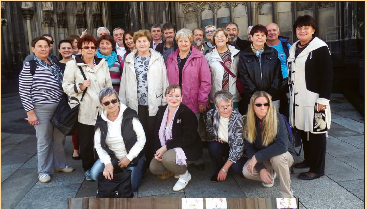
Kolín nad Rýnem