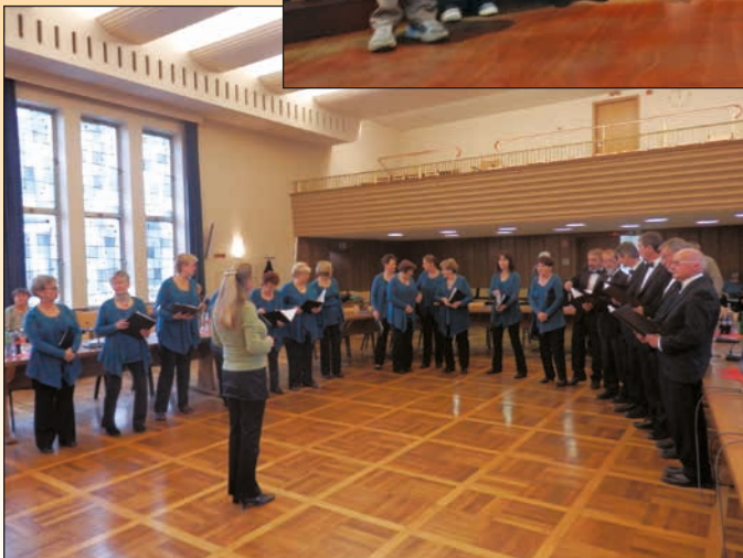
Zpívání na radnici v Hohenlimburgu...