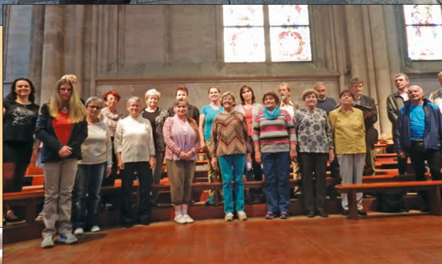
Vystoupení v Cologne Cathedral (Dom) – Kolín nad Rýnem